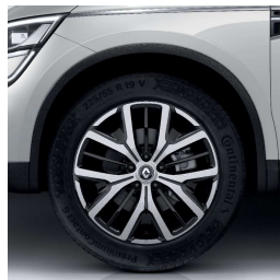
Aluminijumski naplatci 19" Proteus