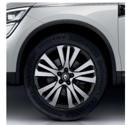
Aluminijumski naplatci 19" Initiale Paris