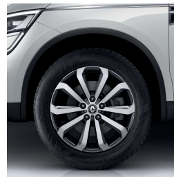
Aluminijumski naplatci 18" Taranis