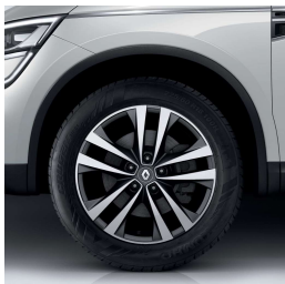
Aluminijumski naplatci 18" Argonaute