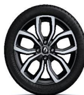
Aluminijumski naplatci 16" Pullsize - Crna (5)