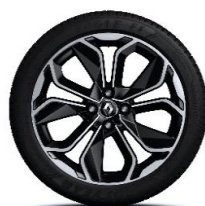
Aluminijumski naplatci 17" Optemic - Hrom i crna (6)