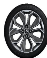
Aluminijumski naplatci 17" Optemic - Hrom i siva (6)