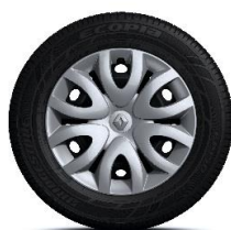
15" ukrasni poklopci Paradise