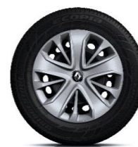
15" ukrasni poklopci Lagoon