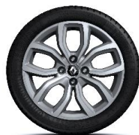
Aluminijumski naplatci 16" Pulsizer - Hrom