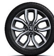
Aluminijumski naplatci 16" Pullsize - Siva (5)