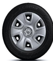
15" ukrasni poklopci Extreme