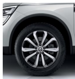
Aluminijumski naplatci 18" Taranis