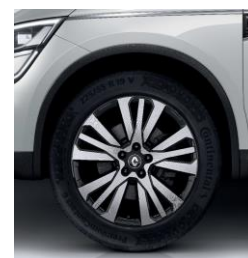
Aluminijumski naplatci 19" Initiale Paris