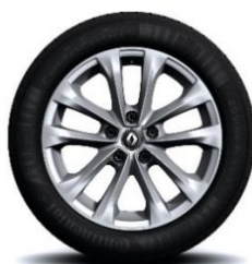
Aluminijumski naplatci 17" Exception