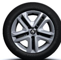
Čelični naplatci Flexwheel 16" sa ukrasnim poklopcima naplatka Complea