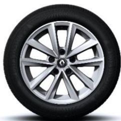
Aluminijumski naplatci 16" Silverline