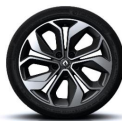
Aluminijumski naplatci 18" Grandtour