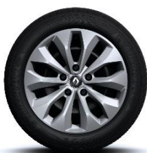
Čelični naplatci 16" sa ukrasnim poklopcima naplatka Florida