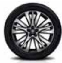
PLATIŠČA IZ LAHKE LITINE 19" INITIALE PARIS