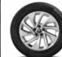
PLATIŠČA IZ LAHKE LITINE 18" LAPIAZ*