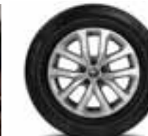
PLATIŠČA IZ LAHKE LITINE 17" AQUILA