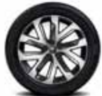
PLATIŠČA IZ LAHKE LITINE 19" QUARTZ*