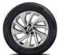
PLATIŠČA IZ LAHKE LITINE 18" LAPIAZ