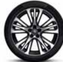
Aluminijumski naplatci 19" Initiale Paris