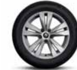
Aluminijumski naplatci 17" Bayadere