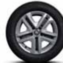
16" Flexwheel ukrasni poklopac Complea