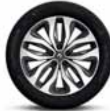
Aluminijumski naplatci 18" Duetto