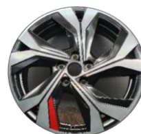
Aluminijumski naplaci 18" E-Tech engineered