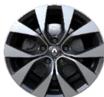
Aluminijumski naplaci 17" Bahamas