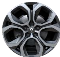
Aluminijumski naplaci 18" Pasadena