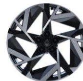
aluminijumski naplaci 19" Elixir