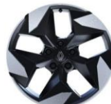
aluminijumski naplaci 18" Black Hole