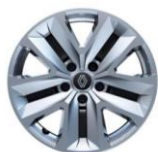
čelični naplaci 17" Nymphaea

S = serija O = opcija P = paket - = nije dostupno