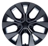
aluminijumski naplaci 17" Eridis