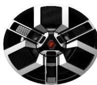
aluminijumski 18" naplaci Techno