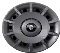
čelični 18" naplaci Disco