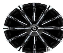
aluminijumski 18" naplaci Chrono