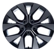
aluminijumski naplaci 17" Eridis