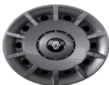
čelični 18" naplaci Disco