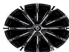
aluminijumski 18" naplaci Chrono