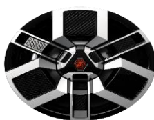
aluminijumski 18" naplaci Techno